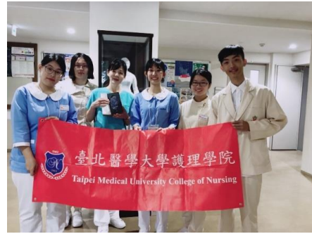
學生至日本北海道大學見習