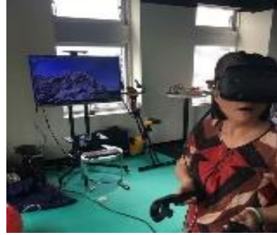
藉由虛擬實境提升高齡者身心理健康