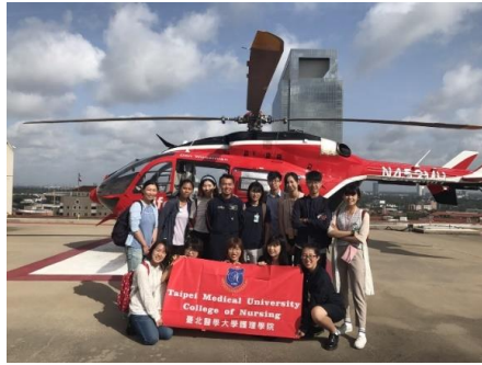
學生至美國德州大學見習