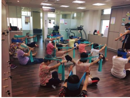
執行高齡者健康促進方案