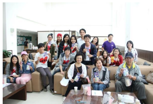
高齡長照服務學習